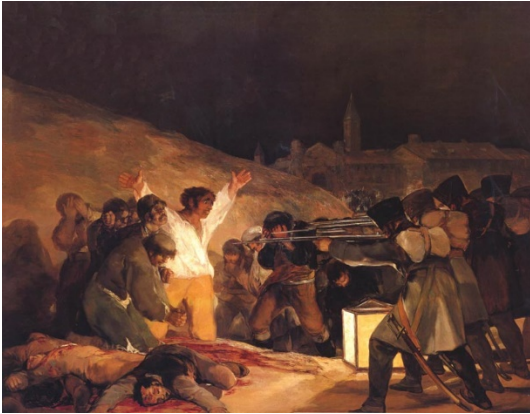
"Il tre di maggio 1808" - 1813-1814, olio su tela, cm 268 x 347, Prado, Madrid.